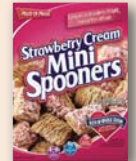
■ Strawberry Cream Mini Spoons ★