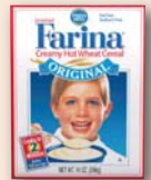
■ Farina Mills Original Hot Wheat Farina